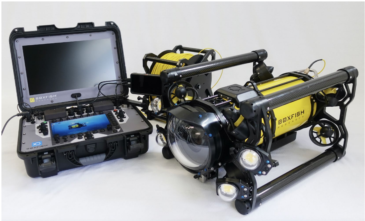
Vehículo operado de manera remota (ROV, por sus siglas en inglés) modelo Boxfish .