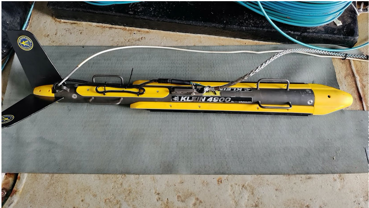
Sonar de barrido lateral modelo Klein Marine System 4900 Side-Scan Sonar .