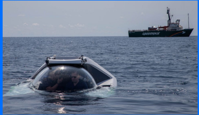
Sumergible tripulado por dos personas U-Boat Worx NEMO.

Los videos obtenidos con el ROV Boxfish fueron revisados en laboratorio con un monitor de alta definición y se fueron congelando cuadros considerando la calidad de la imagen y estos fueron exportados a un programa de edición de imagen para mejorar iluminación y contraste y así identificar mejor los organismos presentes en cada toma.